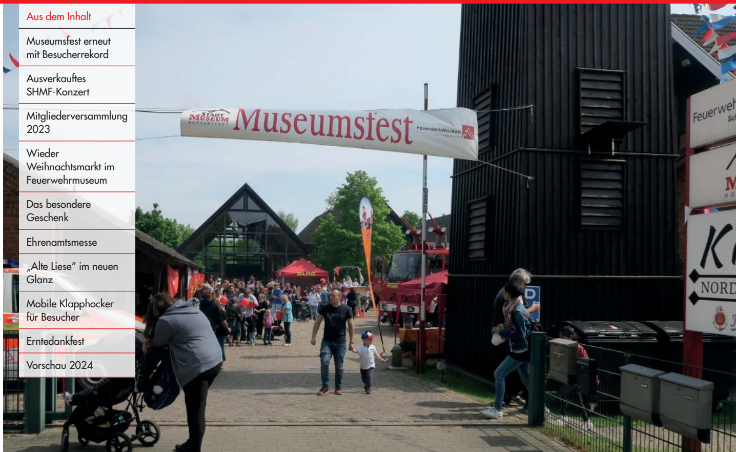
15. Norderstedter Museumsfest am 21. Mai 2023, Foto: FMSH