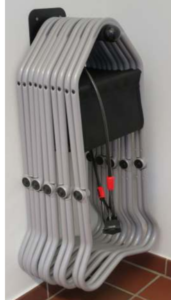
Klapphocker am Haken

Gegen Hinterlegung eines Pfandes an der Kasse können seit kurzem Klapphocker ausgeliehen und für den Museumsbesuch mitgenommen werden. Fünf von ihnen befinden sich an einem Haken bei der Garderobe. Für Gruppen sind weitere 15 Klapphocker vorhanden. Das Modell „New York“ mit außerordentlichem Sitzkomfort wiegt lediglich 2,4 kg und ist für ein Gewicht von bis zu 130 kg zugelassen. Der schwedische Hersteller Lectus ist Spezialist für Klapphocker und hat auch dieses Modell speziell für Museen weltweit entwickelt. (hb)