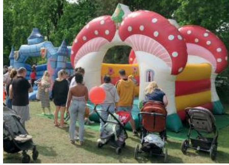
Hüpfburgen Transsylvanien und Fliegenpilz