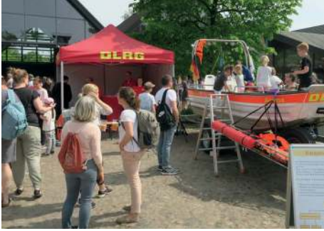
Stand der DLRG mit Rettungsboot