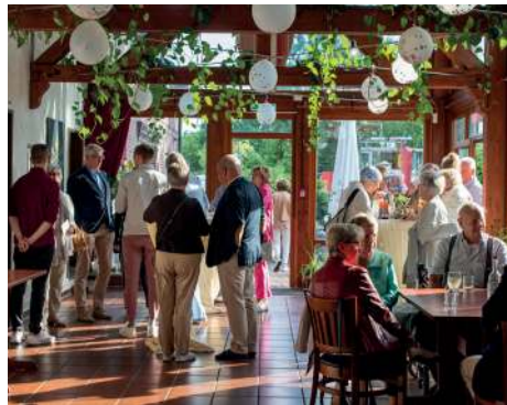
Gemütliches Beisammensein im Museumsrestaurant KiM's