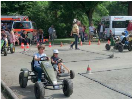
Parcours für Keltcars