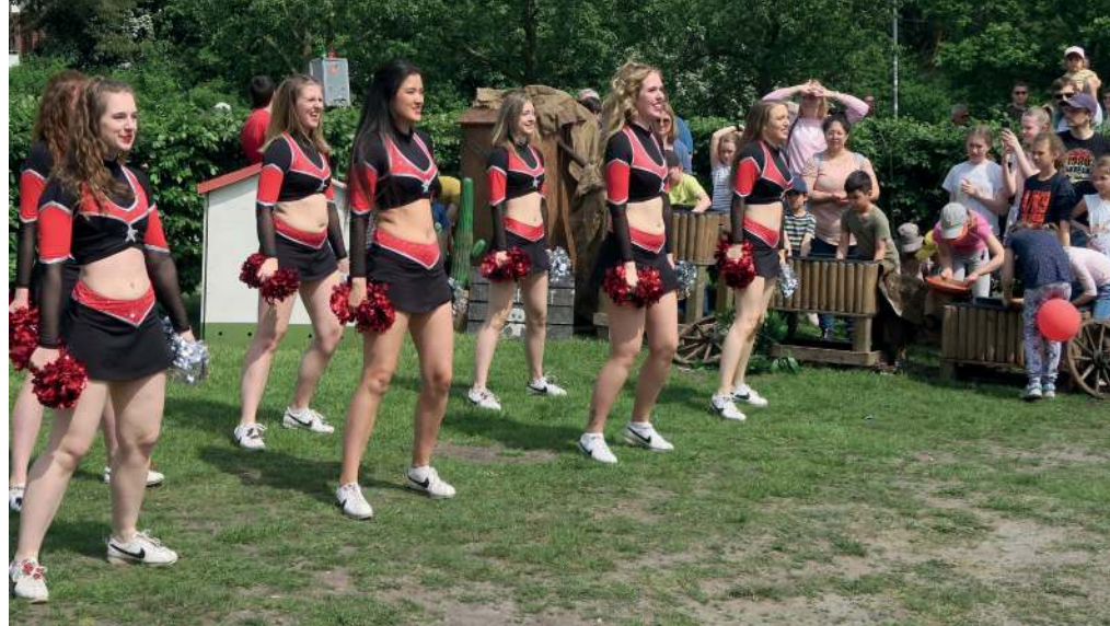
Cheerleader (links) und Goldwaschanlage (rechts)

Geboten wurden zahlreiche Mitmachaktionen für die kleinen Gäste. Neue Attraktion war in diesem Jahr ein Tanklöschfahrzeug der Freiwilligen Feuerwehr Ratzeburg auf der Basis eines umgebauten Wasserwerfers der Bundespolizei. Weitere Highlights waren die beiden Vorführungen mit den Cheerleadern (Minis, Juniors, Seniors und Masters) des Sportvereins Friedrichsgabe sowie die Vorführung der Rettungshundestaffel des DRK, die außergewöhnlichen Luftballonfiguren des