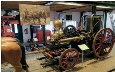
Dampfdruckspritze „Alte Liese“

In Schleswig-Holstein blieb die seit dem 17. Jahrhundert hergestellte Handdruckspritze bis in die 1930er Jahre hinein das wichtigste Löschgerät im ländlichen Raum. Die Industrialisierung führte zu einer Massenproduktion von Handdruckspritzen und zu Wasserpumpen mit einer Dampfmaschine, den Dampfdruckspritzen. Die Dampfdruckspritzen hatten eine deutlich höhere Pumpleistung als die Handdruckspritzen und konnten außerdem mit deutlich weniger Personal betrieben werden. Aufgrund des hohen Anschaffungspreises konnten sich nur wohlhabende Kommunen solche Dampfdruckspritzen leisten. Ein solches Exemplar befindet sich seit 23 Jahren im Feuerwehrmuseum Schleswig-Holstein in Norderstedt. Die hier ausgestellte Dampfdruckspritze „Alte Liese“ – ihr Name spielt wohl auf die treuen Pferde bei der Feuerwehr an – wurde 1869 von der Firma Lange & Gehrken in Ottensen nach englischem Vorbild gebaut und war bei der Altonaer Berufsfeuerwehr bis 1911 im Einsatz. Zwei oder vier Pferde zogen diese Dampfdruckspritze zum Einsatzort. Sie wiegt ohne Wasserfüllung 3,5 Tonnen. Seit der Außerdienststellung sind viele bewegliche Teile der „Alten Liese“