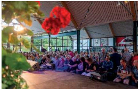
Blick von der Bühne auf das Publikum