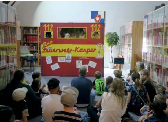
Hamburger Feuerwehr-Kasper

Das traditionelle Norderstedter Museumsfest fand dieses Jahr am 21. Mai statt. Der Eintritt für das Feuerwehrmuseum Schleswig-Holstein und das Stadtmuseum Norderstedt war an diesem Aktionstag im Rahmen des Internationalen Museumstages (IMT) frei. Bei wunderbarem Wetter kamen rund 6.000 Besucher – wieder ein neuer Rekord! Damit war das Museumsfest in Norderstedt die am meisten besuchte Veranstaltung am IMT in Schleswig-Holstein und Hamburg.