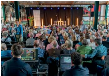
Blick von der Technik auf die Bühne