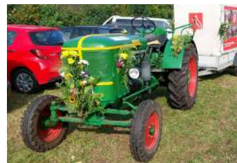
Festlich geschmückter Trecker mit Anhänger, Foto: Peter Lienau

museum Schleswig-Holstein beteiligte sich an diesem Festumzug mit einem Deutz F2L 514/4 und einem Anhänger mit Hochplane, auf der diverse Motive aus dem Feuerwehrmuseum abgebildet sind. Gefahren wurde das Gespann vom ehrenamtlichen Helfer Peter Lienau. (hb)