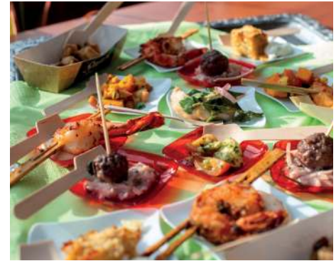
Leckeres Buffet zur Stärkung