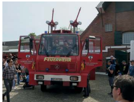
Wasserwerfer als Tanklöschfahrzeug

Das korrekte Verhalten im Straßenverkehr wurde auf einem Kettcar-Parcours geübt. Fahr-